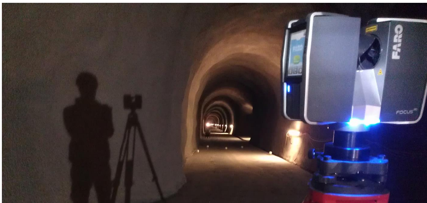
Aufnahme Reservoir Stollen Kraftwerk Kaiserstuhl, OW.