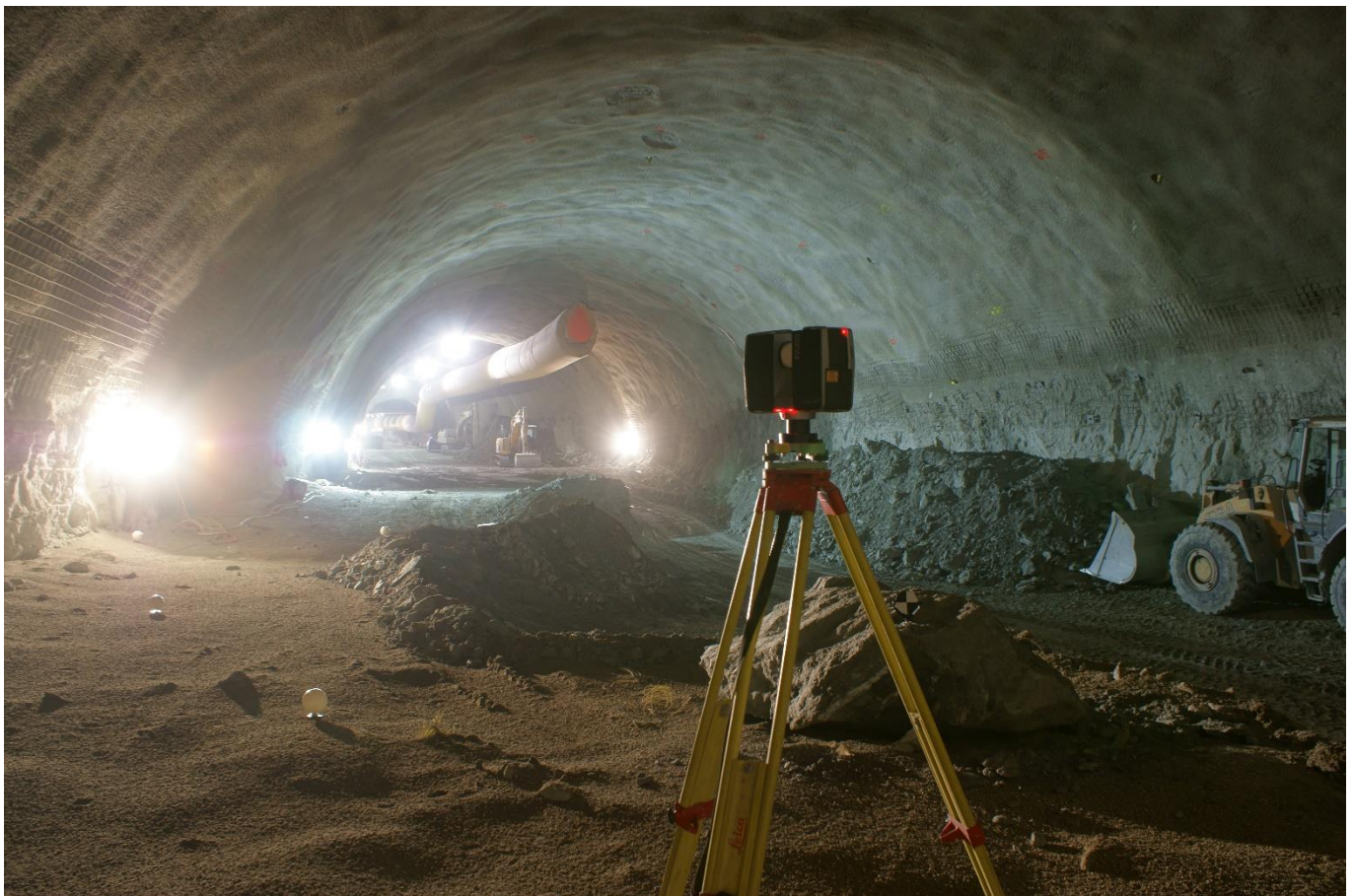
Flächenhafte Profilkontrolle Vispertaltunnel.

Aufgrund des hohen Detaillierungsgrades ist es zudem möglich, umfangreiche Vergleiche mit Sollangaben zu erstellen.